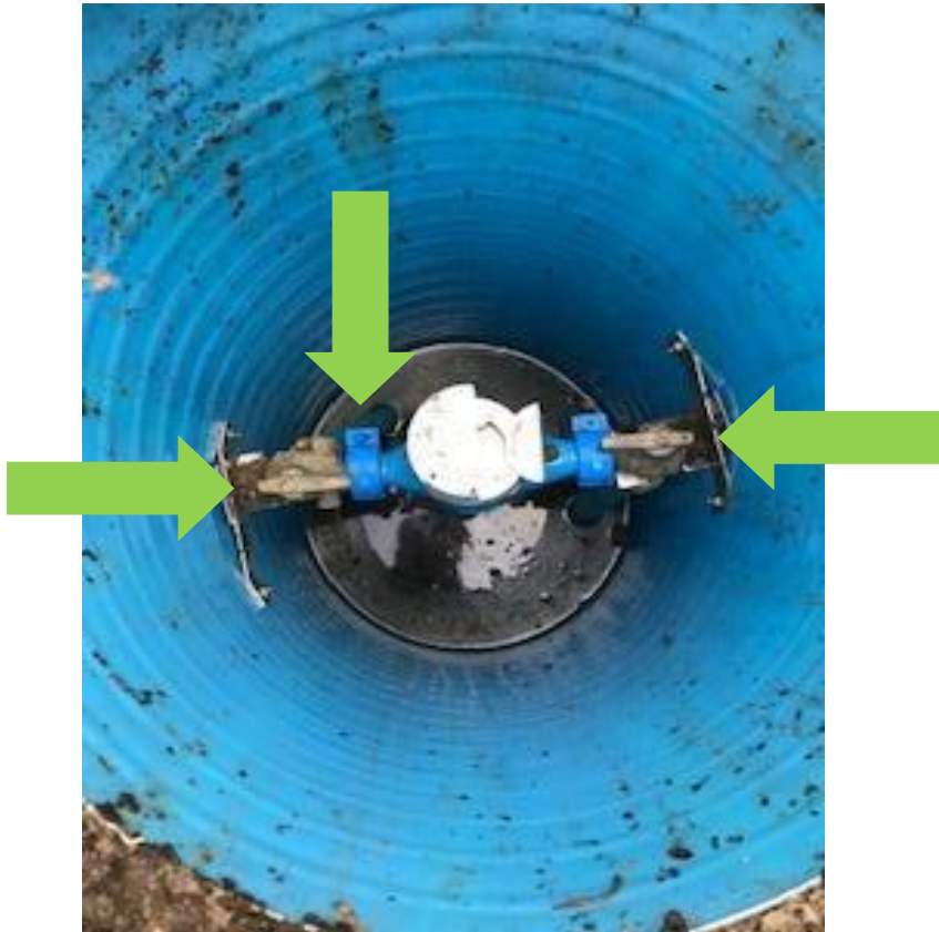
Her er der åbent for tilslutning til brønd og fra brønd til hus. hus

Der vil IKKE blive lukket for vandforsyningen som hidtil.